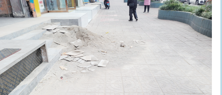
2月14日,记者在市区河阳路看见,一商家将装修产生的建筑垃圾随意堆放在人行道上,不仅对过往群众通行造成不便,而且影响市容市貌。