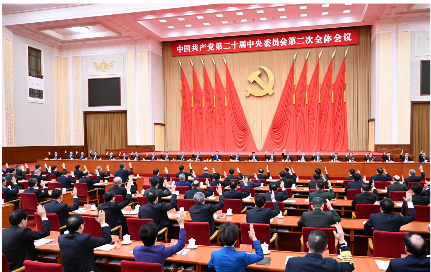
中国共产党第二十届中央委员会第二次全体会议,于2023年2月26日至28日在北京举行。中央委员会总书记习近平作重要讲话。