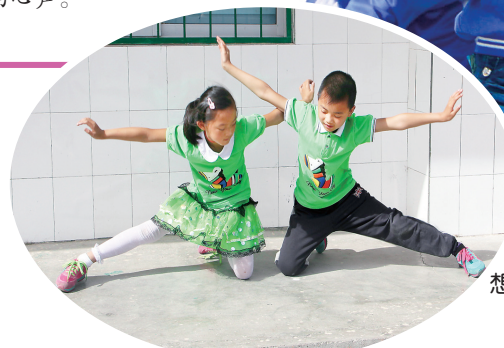
排练庆“六一”舞蹈节目《鸿雁》