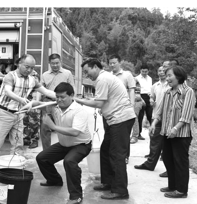
水务人员在现场组织为老弱户、缺劳户送水。

本报讯(杨健康 文/图)自今年5月以来,剑阁县境内多晴少雨,干旱十分严重,一些乡镇村组居民饮水十分困难。该县防汛抗旱指挥部及时启动抗旱预案,组织人员寻找水源。 技术人员在走村串户调查中得知,缺水比较严重的下寺镇友于村7组、4组共300余群众的饮水非常困难。6月19日,水务部门组织消防队用车辆沿公路为村民送来了生活用水,解决干旱严重给群众带来的人畜饮水困难问题。 据了解,截至6月20日,全县累计出动抗旱救灾次数167次,出动人员547人次,出动车辆255辆次,行程超过2000多公里,送水3000余吨,惠及群众1.56万余人。目前,剑阁县境内的旱情仍在持续。