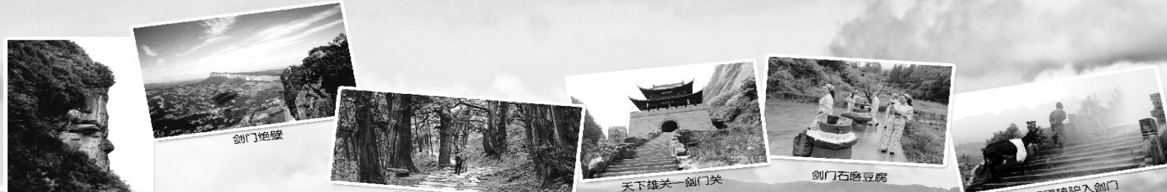
惊险的过门坎, 最深的古栈道, 最热的三国城, 最险的列国寺, 最奇的石人山, 最壮的剑门关, 最秀的风景区, 最绿的合德峡, 最奇的凤凰岭, 最纯的白夹林, 最值得一去的, 剑阁, 剑阁, 剑阁剑阁剑阁!