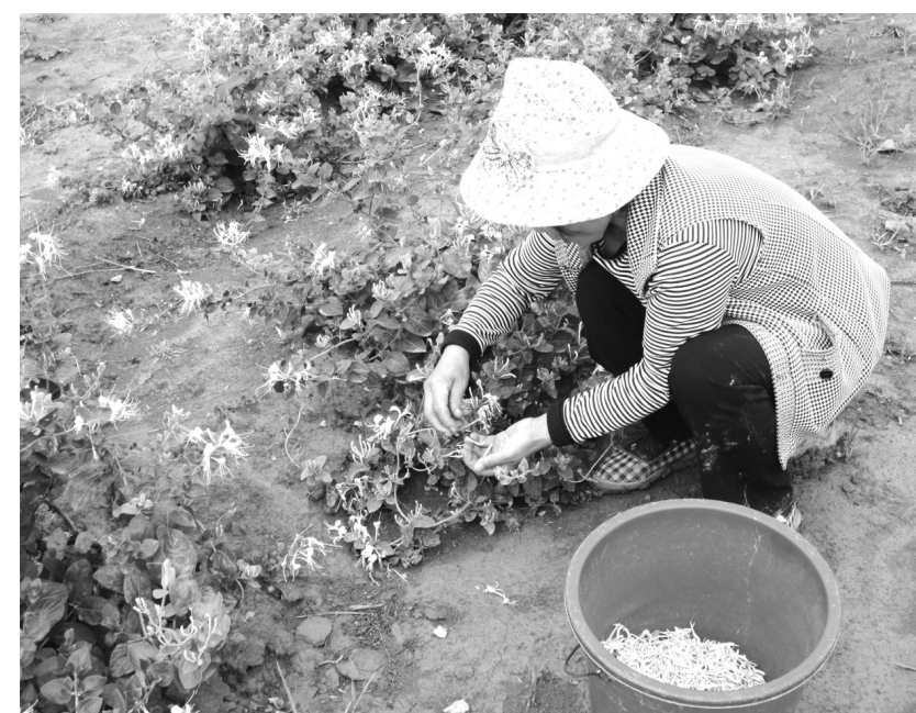
花农正在采摘金银花鲜花。

本报讯(梁杰 蒲元忠 记者 朱斗峰 文/图)近日,记者路过剑阁县高池乡核桃产业园区,只见园区内金银花正正当时,一群男女老少正在兴高采烈地采摘这难能可贵的盛夏“果实”。 据悉,2012年秋季,该县高池乡引进业主,以“公司+农户+基地”的合作模式,积极争取林业项目支持,在高池乡场镇附近的茶场建设核桃产业示范园510亩,林下套种金银花480亩,当下,已有210亩金银花开花见效。预计能产鲜花42吨,直接经济效益达112万元,基地林农人均增收800元。金银花俨然已成为林下经济作物家族中农民增收的新贵。 高池乡核桃园区建设坚持长短期经济效益相结合、乔灌品种相结合的林业产业发展模式,很好地弥补了核桃种植园建设初期的经济收益空缺,为全县核桃产业及林下经济发展起到很好示范引领作用。近几年,除高池乡外,全县结合林业工程造林项目,充分利用林下空间种植金银花近万亩。目前,元山、公兴等乡金银花种植已初见成效,元山镇已引进业主建起金银花深加工生产线,为最大程度发挥金银花经济效益做好充分准备。