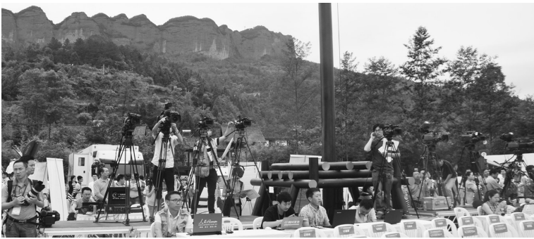
2014中国四川国际文化旅游节·美丽中国剑门蜀道