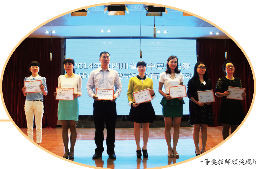
一等奖教师颁奖现场

来自各市(州)的22名选手以选课内容为七年级和八年级两个组别。活动以七、八年级分组同时在东城实验学校两个展厅进行展评后,再集中进行学科教学