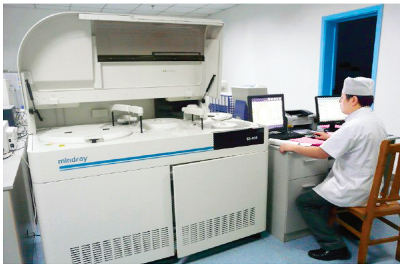
BS-830全自动高速生化分析仪