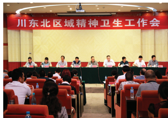
举办川东北地区首次精神卫生工作推进会