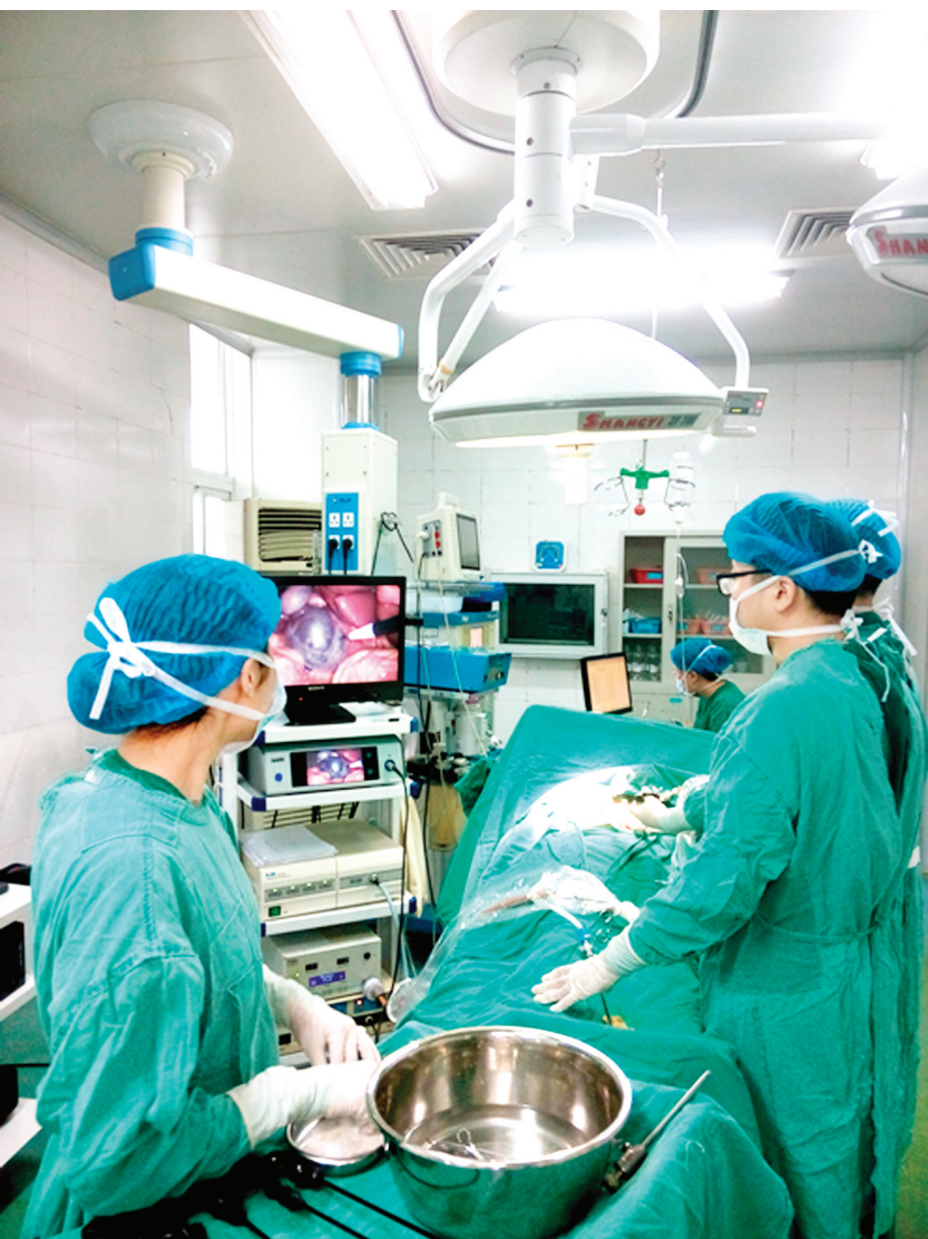
普外科开展首例腹腔镜下肝脏多发巨大囊肿去顶减压引流手术