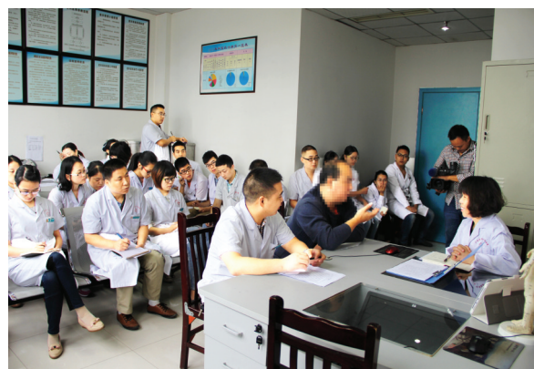
北大六院教授现场查房