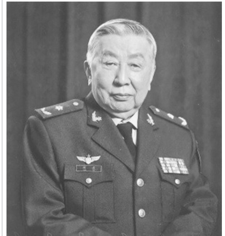
德艺双馨的人民艺术家阎肃(资料图)