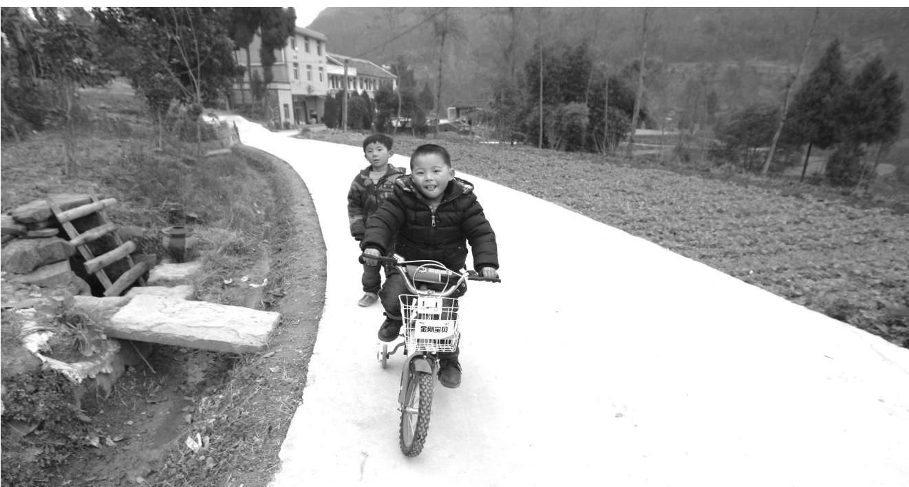
村里通了水泥路,两小朋友在路上骑着自行车。