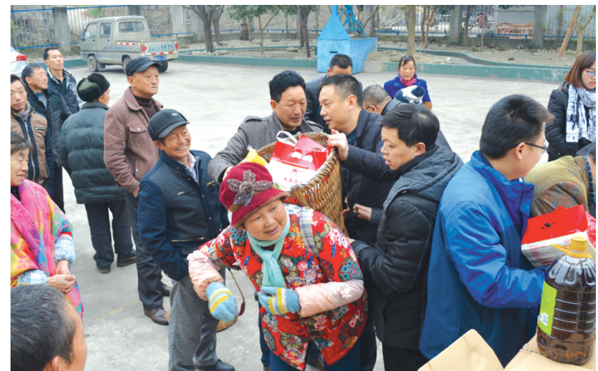
2016年12月29日,利州区委政法委负责人带领区档案局、区招商局、荣山镇的帮村干部,深入到荣山镇平基村,开展帮扶活动,走访慰问了贫困群众和困难党员。

向他们每户发放了20斤米、4斤面、10斤肉和一桶油,并一一详细了解了每户的情况,向他们讲解了有关惠民帮扶政策,鼓励他们要克服目前的困难,鼓起生活勇气,健康快乐地生活。