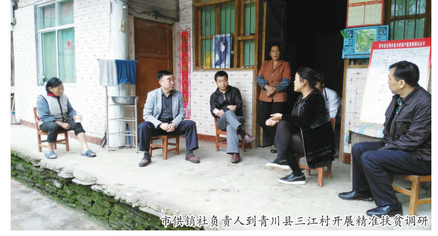
市供销社负责人到青川县三江村开展精准扶贫调研

日用消费品零售持续增长。依托“广供天下”超市等商贸企业,通过市、县、区购物超市、乡、镇级连锁店、村级便民网点经营网络,大力开展连锁经营,丰富城乡市场商品供应。今年一季度,全市系统实现消费品零售额8.3亿元,同比增长40%。农业生产资料有效供