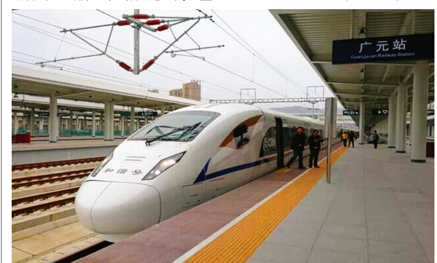
西成高铁广元站台(列车停靠有用户占用,非空载小区)下载速率可达60Mbps以上。