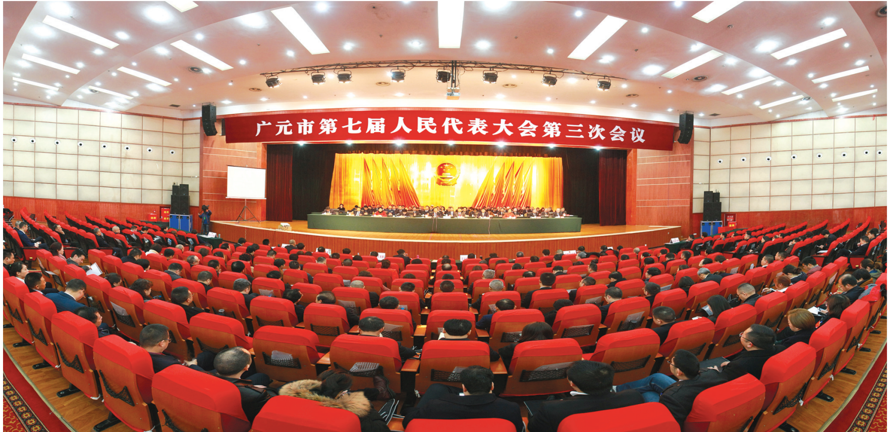
1月8日上午,广元市第七届人民代表大会第三次会议闭幕。

本报讯(记者 蒲洪旭)1月8日上午,广元市第七届人民代表大会第三次会议圆满完成各项议程,在广元会展艺术中心凤凰大剧院闭幕。