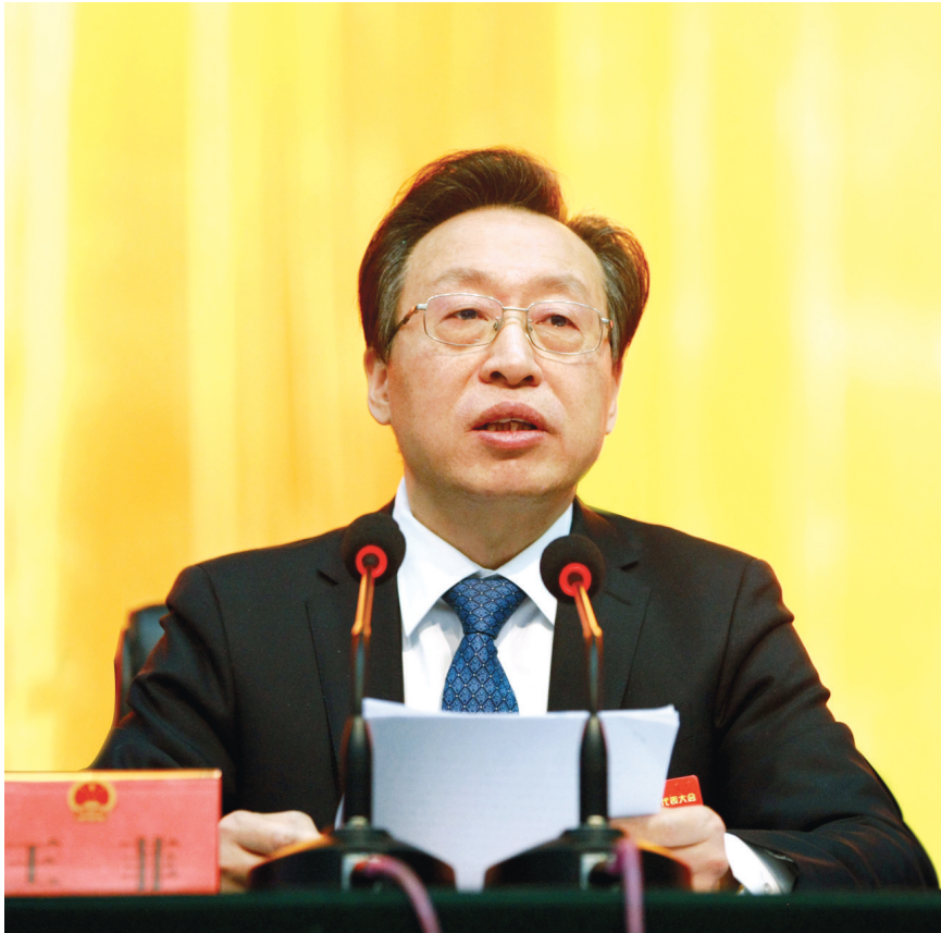
王菲主持闭幕大会并讲话