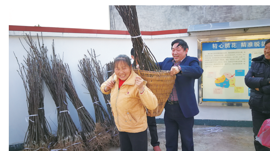
12日,苍溪县县委办公室组织驻村工作队队员、帮扶责任人深入该县陵江镇九湾村开展“三同三进”活动,并为贫困户栽种黄金梨树苗1000余株。

旅客还可自主选座,购票系统支持C、D、G字头的动车组列车自主选座。如果剩余车票不能满足需求,系统将自动分配席位,如不选择选座,系统将自动分配席位。