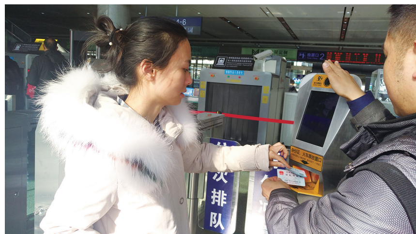
16日,旅客正在广元火车站进行人脸识别。

同时铁路部门还对验证码进行了调整,删除了清晰度不高、难辨认的图片,并且不断筛选更新和选择清晰度的图片,让旅客更顺畅的购票。