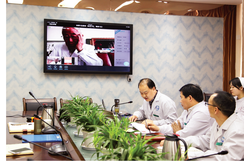
中国工程院院士郭应禄远程指导工作