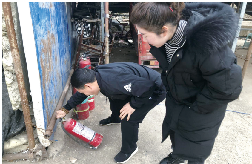
近日,东坝街道东屏社区组织工作人员对辖区内企业的安全生产工作、消防设施设备等进行检查。图为检查现场。

据农业农村部监测,2018年12月份全国生猪存栏同比下降4.8%;能繁母猪存栏同比下降8.3%,连续3个月跌幅超过5%的预警线。“这意味着今年下半年生猪上市量偏少,猪价上涨的可能性较大。”唐珂说,建议广大养殖户在做好非洲猪瘟疫情防控的基础上,适时调整养殖结构,增加补栏。农业农村部也将督促各地进一步落实保障生产供给、畅通种猪和仔猪调运的相关政策,尽量保证肥猪正常出栏,补得了、卖得出,解决广大养殖户增养补栏的后顾之忧。