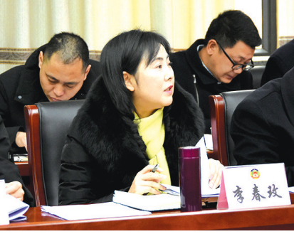
与会者在分组讨论上发言。