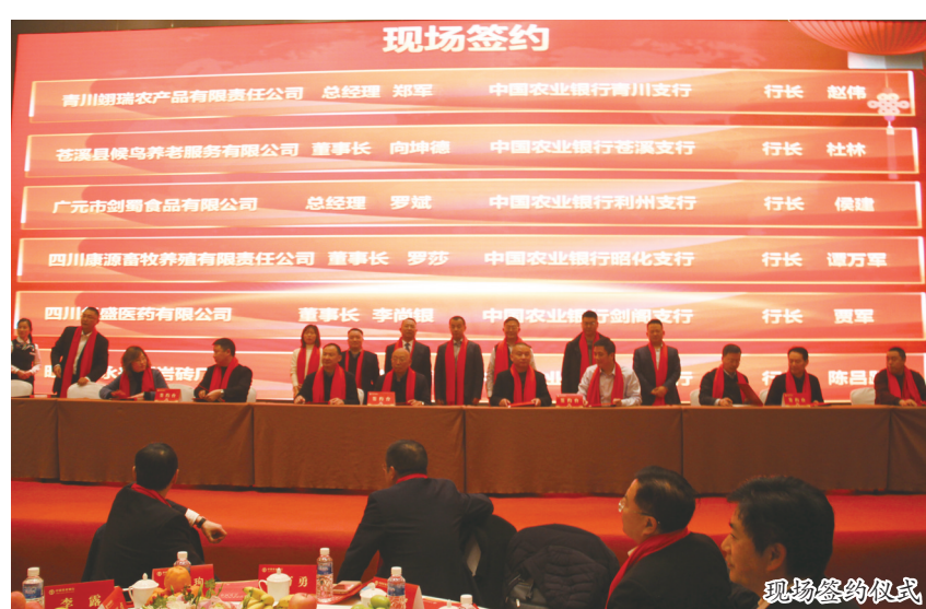
现场签约仪式 据了解,农行广元分行高度重视民营和小微企业金融服务工作,聚焦企业融资需求,多措并举促进民营经济发展。2018年,该行新发放民营小微企业贷款7.35亿元,较年初净增5.31亿元。同时,坚决落实减费让利政策,对小微企业贷款一律执行国家基准利率,综合贷款利率从2018年初的5.35%降至年末的4.98%,为全市

17日,农行广元分行2019年民营小微企业融资对接会在嘉华酒店举行。会议邀请了市政府、人行广元市中心支行、广元银保监分局、广元市民营办、广元市金融工作局相关领导参加,四川省青川川川珍实业有限公司、广元市康泰农林专业合作社、广元紫升农业科技开发有限公司等31家民营企业代表应邀参会。 会议指出,近年来,农行广元分行立足市情和经济发展实际,履行使命担当,把强化民营和小微企业服务作为必须承担的政治责任和必须完成的战略任务。针对民营和小微企业信贷需求“短小频急”的特点,该行积极创新产品和服务模式,推出“秒申、秒批、秒贷、秒用、秒还”产品,只要是合格市场主体且经营正常,在农行获取融资就不难。该行郑重承诺,将把此次31位应邀民营小微企业代表作为会后首批融资服务对象,拟授信额度达到2.33亿元,慎重宣布推出服务民营小微企业健康发展的总体目标和信贷支持、减利让利、担保创新、多元服务等“七条措施”。