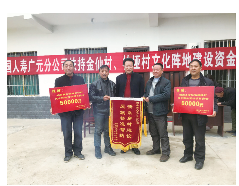
10日,中国人寿保险股份有限公司广元市分公司向剑阁县金仙镇金仙村和柏桠村定向捐赠10万元资金,用于两村文化阵地建设。捐赠仪式上金仙村和柏桠村的群众分别将写有“情系乡村建设、爱献精准帮扶”“扶贫济困送温暖、真情帮扶促发展”字样的两面锦旗送给了中国人寿广元市分公司和广元市金融工作局。 (敖凤蔚)

实体经济及经济社会发展做出了应有的贡献。2019年,农行广元分行将在全面执行监管部门支持实体经济、支持民营小微企业措施的基础上,进一步深化七条具体措施。推出“四张图”工作法,通过制定规划图、施工图、作战图、火线图,建立支持清单,明确任务、落实责任、细化工作,使支持民营小微企业决策部署可视化、具体化、项目化,确保全面完成监管部门下达的目标计划,尽最大努力满足民营小微企业的差异化、个性化金融需求。 会上,与会的政府部门及监管部门负责人结合各自领域谈了支持民营企业的思路与做法,共同交流了相关信息,解决存在的问题。会议搭建了交流的平台,开辟了银企合作新的篇章,为我市经济社会发展作出了新的贡献。 会议现场,农行广元分行还与青川锦瑞农产品、苍溪候鸟养老服务、广元剑阁食品、四川康源畜牧养殖、四川华盛医药、旺苍永兴页岩砖厂6家企业签订合作协议,授信金额达5300万元。 (记者 张然 赵郁)