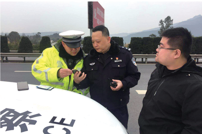
正月初五,一男子用光盘遮挡号牌,结果在昭化收费站遭查。