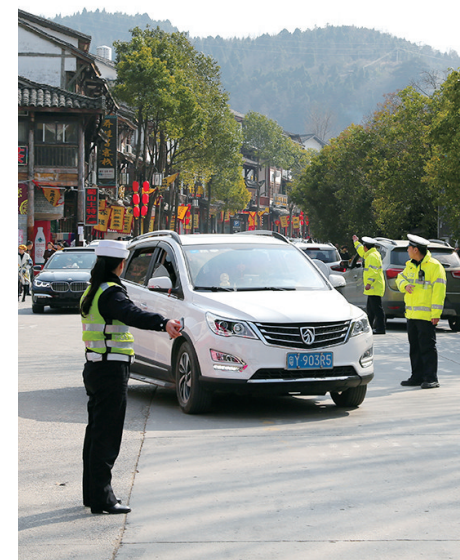
正月初二,剑门关镇交警维持景区交通秩序。