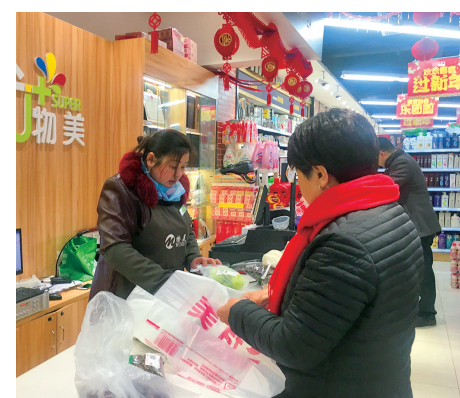
正月初二,春节期间超市不打烊。