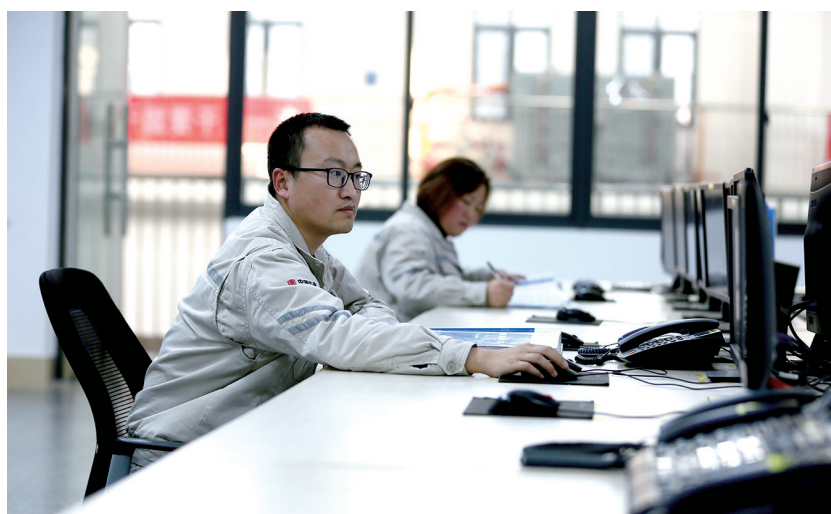
大年三十,广元水电厂工作人员正在值守。