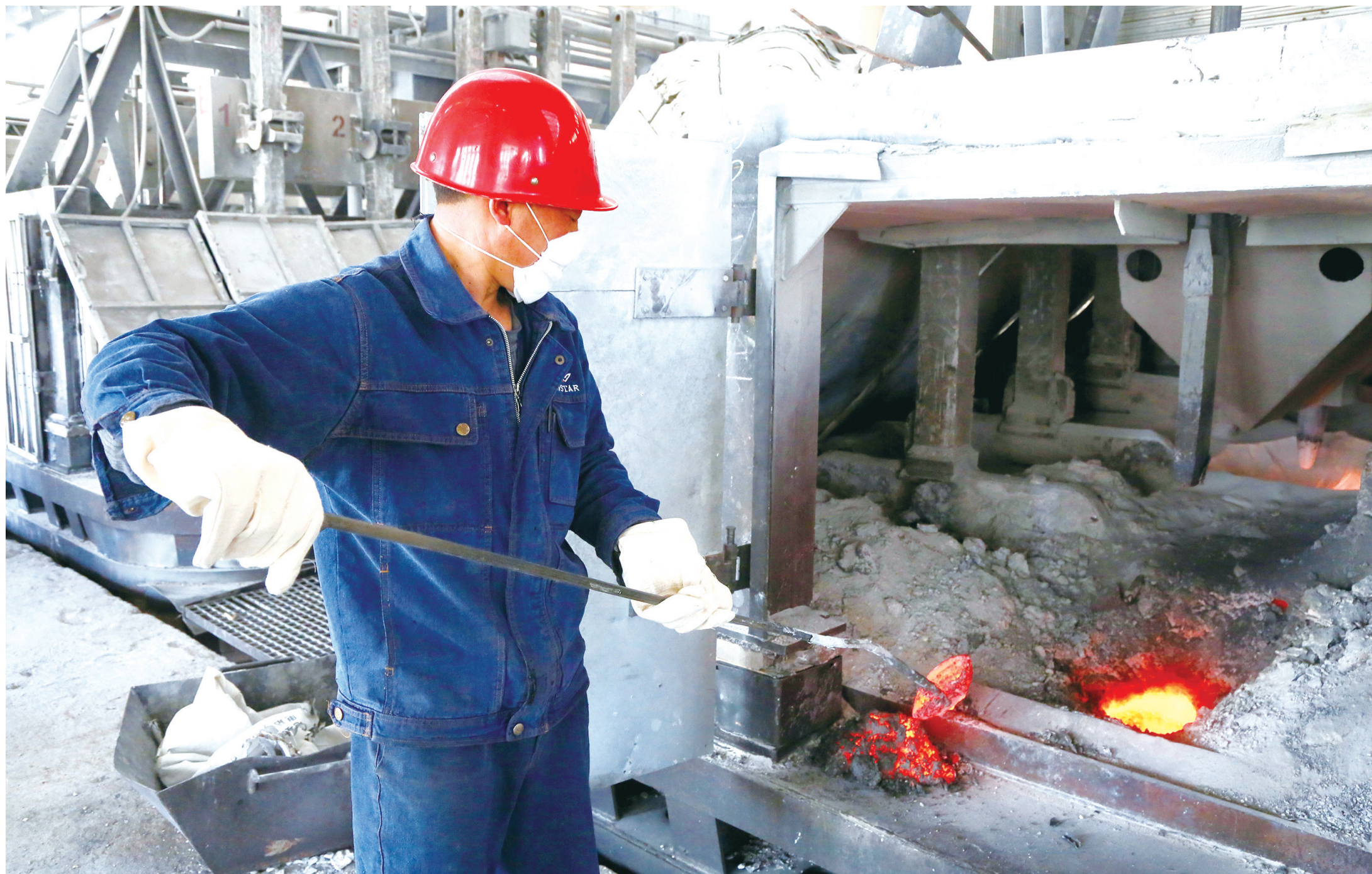
正月初一,启明星铝厂电解车间工人正在检查炭渣。

“岁月不居,时节如流。”所以,我们总在盼着春节,盼着团圆。当你坐在沙发上,争分夺秒扫“敬业福”的时候,有这样一群人,他们为“敬业福”代言,用坚守暖心守护万家团圆。他们是医务工作者,争分夺秒抢救患者