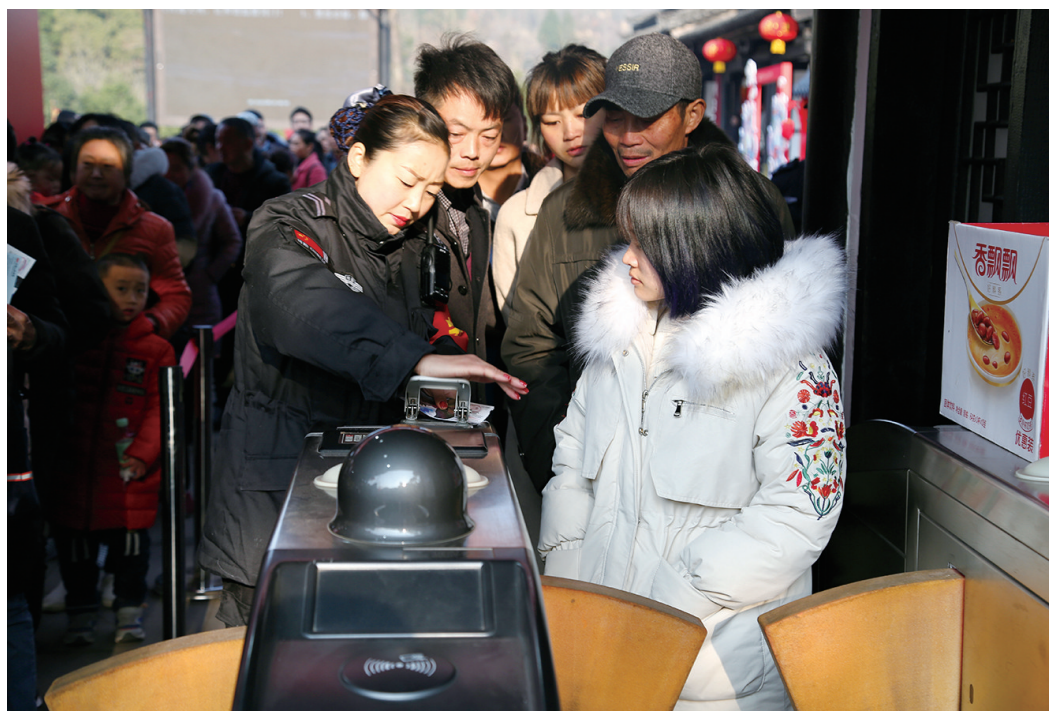
正月初二,景区工作人员忙检票。