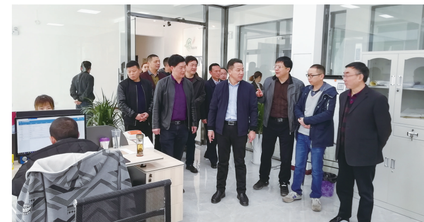
外地供销社考察“广供天下”电子商务公司

组织69户重点工业用电企业开展全市电力市场化交易政策宣讲培训,引导专变工业企业参与直购电预注册,争取直购电优惠政策。给予企业用气优惠,对工业用户使用天然气的入网费减半收取(125元/立方米/日),每户最高不超过12.5万元,力争4月1日起全面取消工业用户入网费。