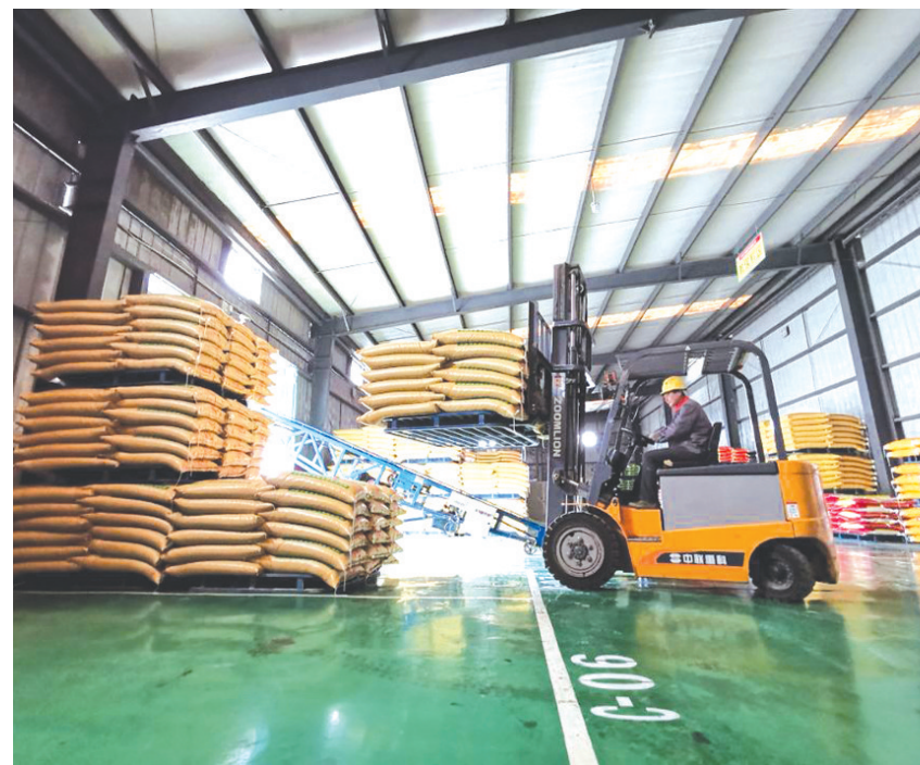
在壮牛农牧工厂内,各环节通力配合,开足马力生产,图为装卸工正在进行货物装车。