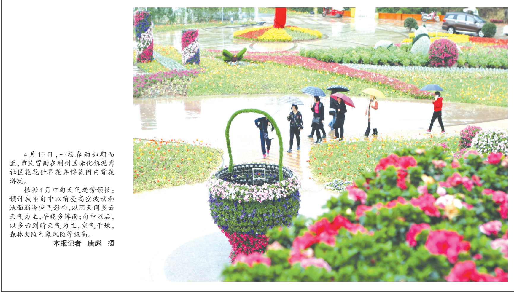
4月10日,一场春雨如期而至,市民冒雨在利州区赤化镇泥窝社区花花世界花卉博览园内赏花游玩。根据4月中旬天气趋势预报:预计我市旬中以前受高空波动和地面弱冷空气影响,以阴天间多云天气为主,早晚多阵雨;旬中以后,以多云到晴天气为主,空气干燥,森林火险气象风险等级高。

会前学习了《四川省禁毒人民战争实施方案(2018-2020年)》。会议要求,要扎实开展宣传教育,推动禁毒宣传教育进学校、进机关、进企业、进农村,提高干部、群众知晓率,推动禁毒工作深入开展。要对照《实施方案》,认真组织研究,细化分解目标任务,落实省上要求,促进我市禁毒工作向前迈进。要坚持问题导向,组织开展专项整治行动和联合执法,加大防范、管制和打击力度,抓好整体推进、督导检查、考核评估等工作。会议审议通过了《广元市金融支持制造业发展的十条措施(送审稿)》。我市将采取用好再贷款和再贴现政策,推动实施产业链金融服务、开展知识产权质押融资、健全融资对接沟通机制、缓解企业流动性融资难题、充分发挥保险的保障作用、引导优势企业实现直接融资、鼓励其他金融服务业助力融资、着力完善信用体系建设、强化银行业金融