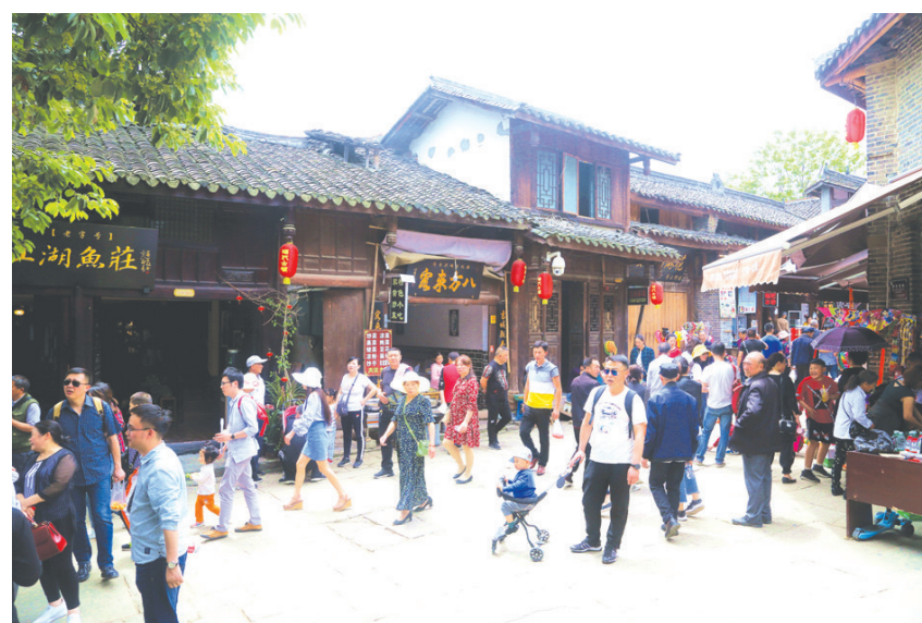
昭化古城内,游客文明有序参观游玩。

在游客尽情游览的同时,景区的工作人员也坚守在岗位,为天南地北而来的游客创造良好景区环境。垃圾桶满