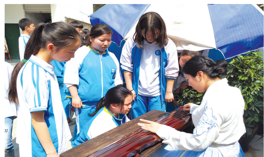
4月25日,我市2019年第一期非遗主题日活动开启,市文化遗产保护中心组织国家级非遗项目“白花石刻”“麻柳刺绣”等进入广元西城中进行了宣传展示,组织市级非遗项目“川派(茂前)古琴”在川北幼专举行了专场演奏会,让两个学校的师生真切感受到了我市非遗项目的独特魅力。图为西城中学生观摩非遗项目。

日常工作中,该大队通过流动巡查和定人定点值守相结合的方式,对农产品交易中心周边乱象进行监管,及时发现、及时制止的效果,有效保障了农产品交易中心周边形成良好的市容秩序,并保持常态。