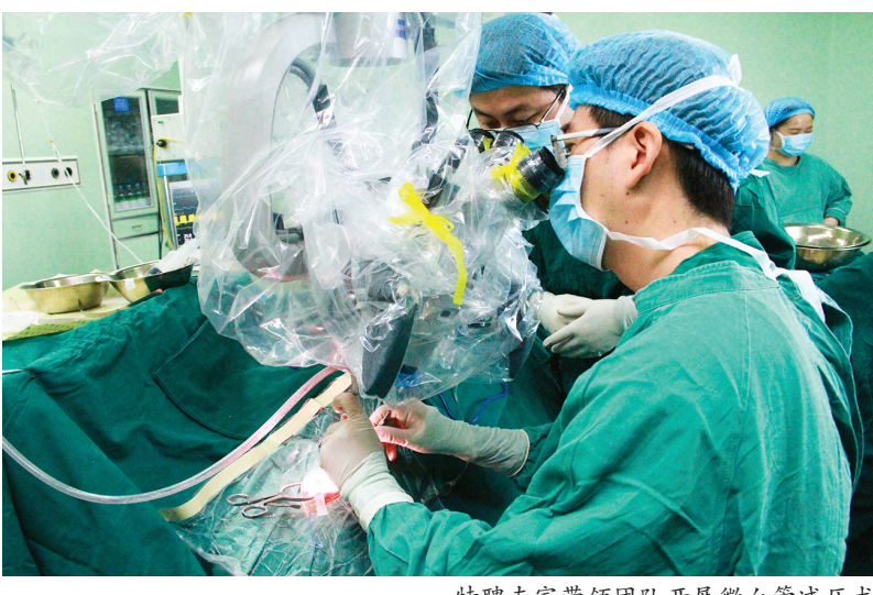
特聘专家带领团队开展微血管减压术