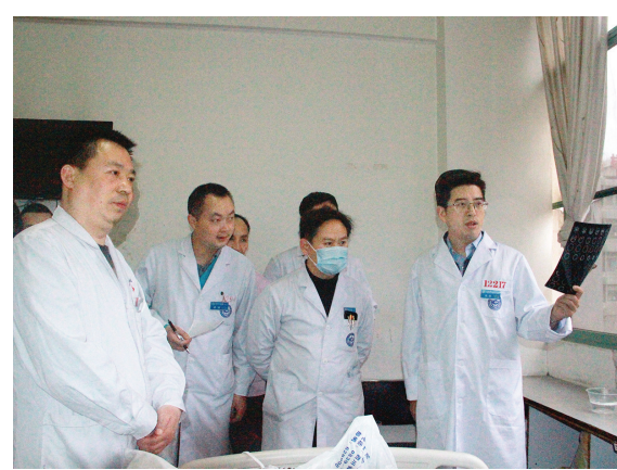
特聘专家查房指导