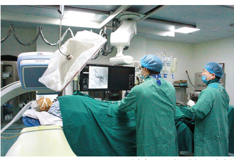
开展复杂脑动脉瘤破裂介入阻塞手术