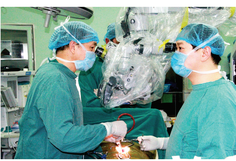
实施脊髓肿瘤切除术

四川大学华西医院神经外科主任医师,教授,博士研究生导师。致力于中枢神经系统血管疾病及肿瘤的诊治和研究,对大型复杂颅内动脉瘤、AVM、脊髓血管畸形及脑出血等疾病的诊断及治疗有较深造诣。擅长脑血管病及颅内肿瘤的治疗,尤其擅长大型复杂颅内动脉瘤、AVM、巨大颅底肿瘤、脑干肿瘤、丘脑肿瘤、高位脊髓内肿瘤等高难度神经外科手术。