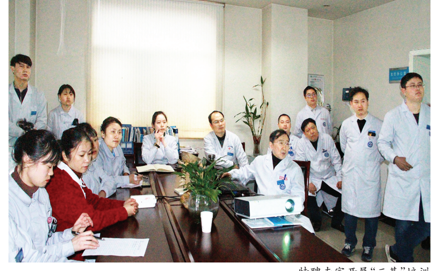
特聘专家开展“三基”培训