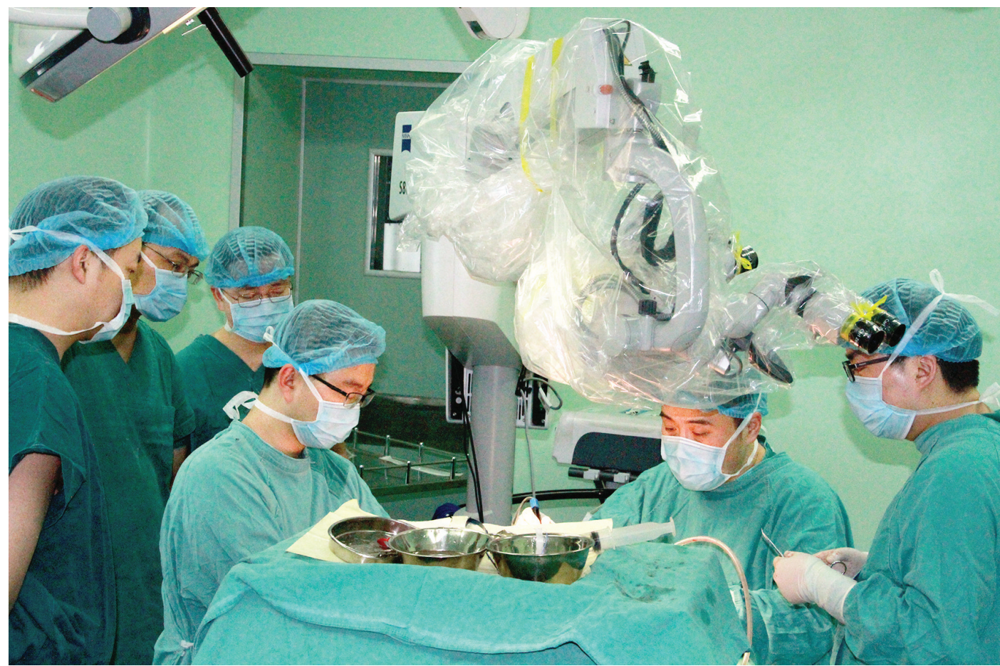
特聘专家带领团队开展脑动脉瘤破裂夹闭手术

紧密型专科医联体启动后,开启了市中心医院神经外科高质量发展模式。1-4月,神经外科手术量同比增长约10%,特别是四级手术增长27.8%、危重病人救治比例较去年同期的62.49%上升到67.94%,出院病人上升15.1%,平均住院日从14.86天下降至13.58天;开展了脑干血管前侧方肿瘤切除术、复杂动脉瘤开颅夹闭术、浸润性巨大垂体瘤切除术等高难度神经外科手术69例;仅1名患者因设施设备因素上转到华西手术;一些选择到成都等地治疗的患者主动回到广元治疗。