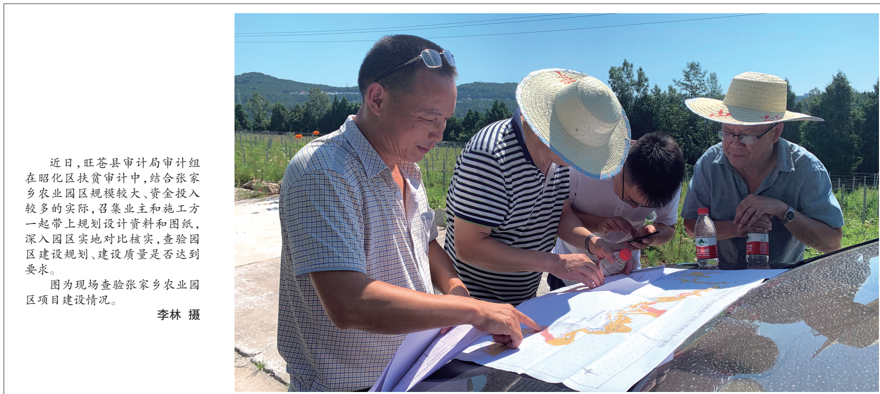
近日,旺苍县审计局审计组在昭化区扶贫审计中,结合张家乡农业园区规模较大、资金投入较多的实际,召集业主和施工方一起带上规划设计资料和图纸,深入园区实地对比核实,查验园区建设规划、建设质量是否达到要求。 图为现场查验张家乡农业园区项目建设情况。

将建立有人值守的垃圾分类驿站、撤桶撤站实行定时定点流动收集、上门或定点收集餐厨垃圾和可回收物、设置生活垃圾分类智能投放箱等多种方式。 为从源头上减少垃圾产生,征求意见稿提出一系列措施,包括加大“限塑令”的执行力度,加强对农副产品批发市场、零售业等重点场所和行业的监督检查,推广使用菜篮子、布袋子;指导电商企业和快递企业利用社区营业网点回收快递包装;推广应用建筑垃圾再生产品等。 (转自8月14日《四川日报》)