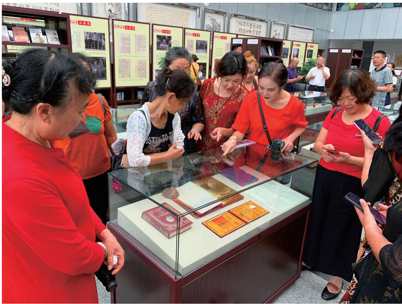
市民在市图书馆参观“邓小平文献展”。