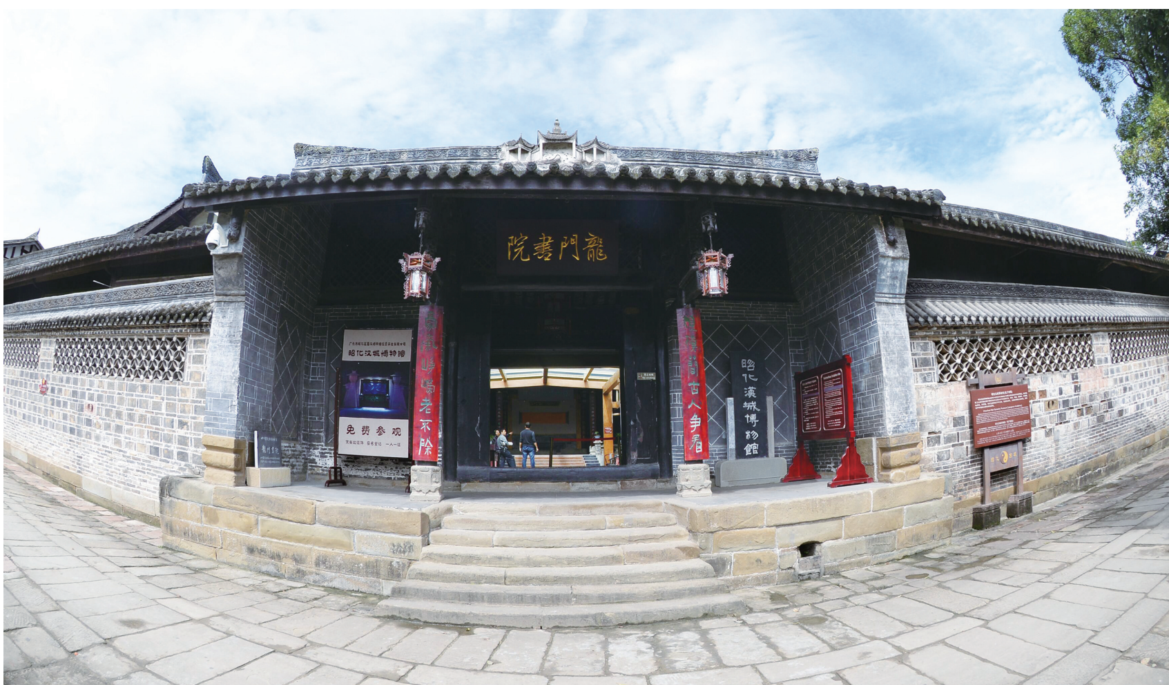
位于昭化古城相府街的龙门书院至今保存完好