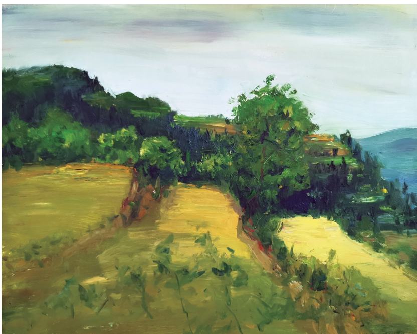
苍溪情(油画) 马敏 作