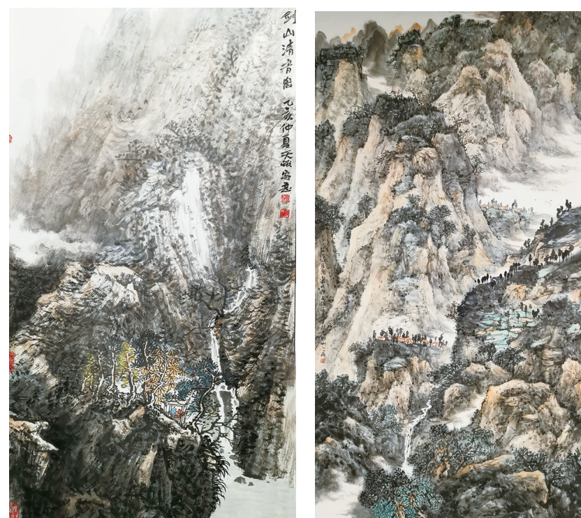
剑山清音图(国画) 赵勇 作