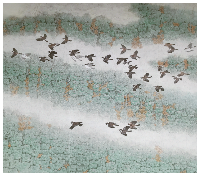
清韵(国画) 黄小兰 作