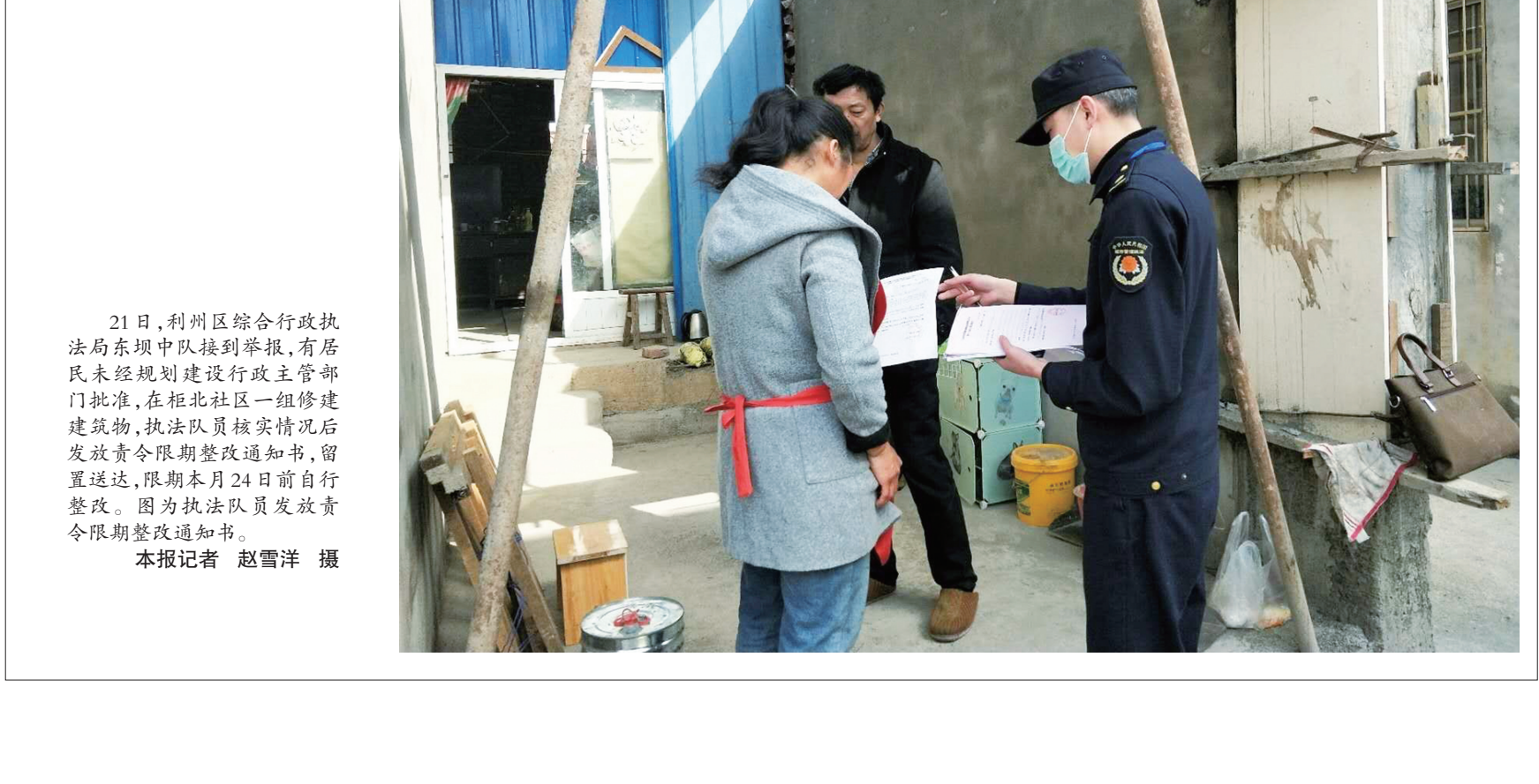
21日,利州区综合行政执法局东坝中队接到举报,有居民未经规划建设行政主管部门批准,在柜北社区一组修建建筑物,执法队员核实情况后发放责令限期整改通知书,留置送达,限期本月24日前自行整改。因为执法队员发放责令限期整改通知书。