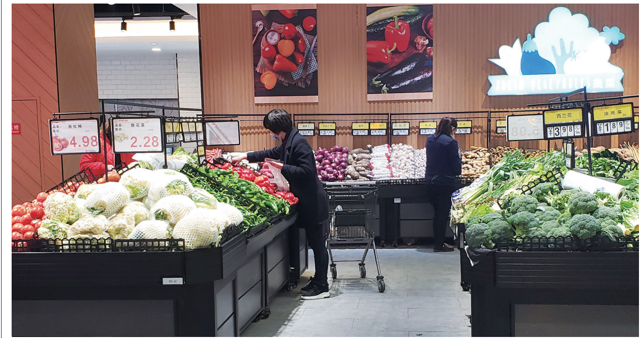
主城区90余家大型超市、连锁便利店和18家农贸市场坚持营业,全力保障生活必需品市场供应。