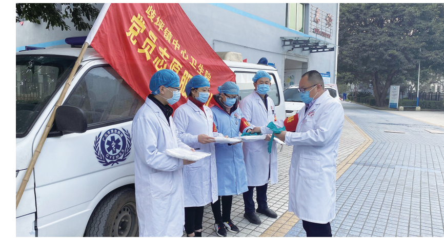
安排部署防疫工作