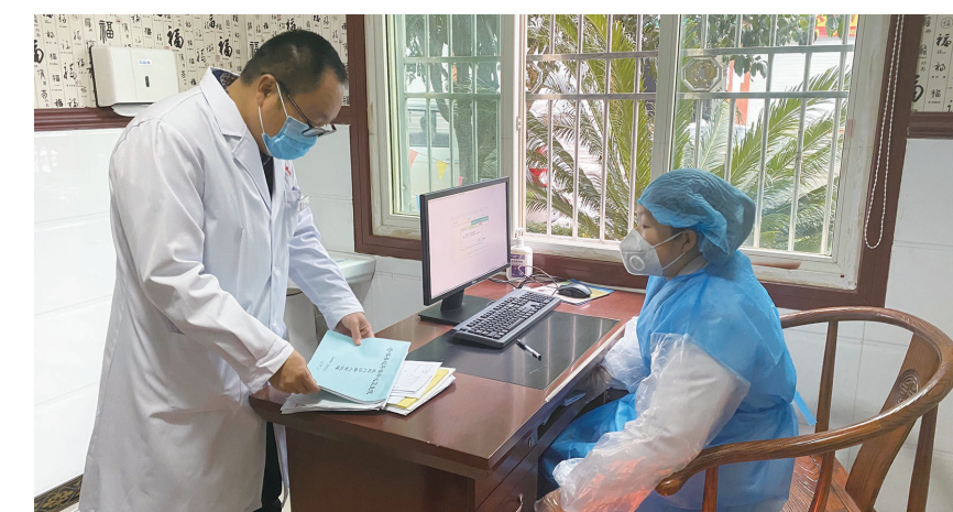
核查疫情防控信息