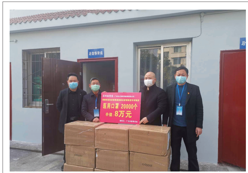
截至2月24日,在广元市经济合作局广东分局和广东省广元市商会秘书处的共同努力下,广东省广元商会募集到善款162000元,将按照捐赠人的要求全部购买医疗用品支援家乡广元的疫情防控工作。

据了解,这些都是市人大代表捐赠的,他们心系防疫一线人员,向河西街道捐赠价值的1.2万元的防疫物资。