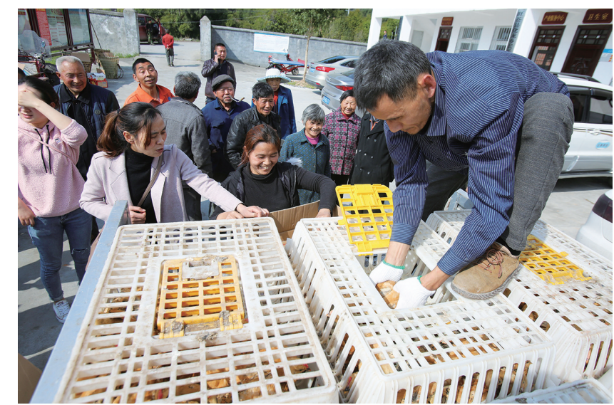
4月7日,旺苍县委办13名帮扶干部自筹资金1.5万元,为结对帮扶的化乡长乐村25户贫困户赠送鸡苗750只,帮助他们发展土鸡养殖产业,确保年度收入稳中有增。此次发放的鸡苗抗病,适应力强,到下半年,预计领取鸡苗的贫困户每户将增收3000余元。图为鸡苗发放现场。

据了解,该局克服登记中心人员不足等因素,不断优化各类业务流程压缩办理时限,由原来法定的30个工作日缩短为5个工作日可办结,部分登记事项做到即时办结。“服务群众永无止境,创新工作永远在路上。”余江表示,下一步,该局力争尽快在年内实现4个工作日办结,积极推进“互联网+不动产登记”,办理时限“更高效”,便民服务“更优质”的“旺苍模式”。该局积极整合自然资源、房管、税务部门职能,实现一套资料现场交易、缴税、受理发证,变“三窗受理”为