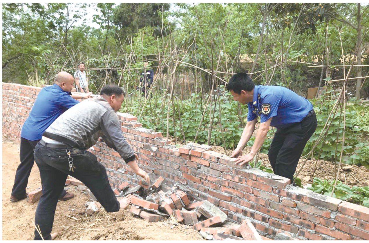
6日,利州区综合行政执法局河西城监中队巡查发现,龙泉社区四组居民抢建建筑物,执法人员现场制止要求其停工,并将墙体拆除。图为拆除现场。

动力装置、三轮车加装动力装置等违反交通规则行为的同时,大力开展突出违法车辆、典型事故案例、事故多发路段、高危风险运输企业和终身禁驾驾驶人“五大曝光”行动,加大对城乡建筑用料和废料运输车、渣土砂石运输车、混凝土运输车、货车超载超限、遗洒飘散载运物等重点车辆交通违法行为的查处力度,集中警力对二轮电动车安装遮阳伞、挡雨篷的予以拆除。召集快递、外卖企业负责人,针对骑手常见的违法行为进行宣教引导。联合快递、外卖企业,与企业管理人员一起上路,开展路面监管。