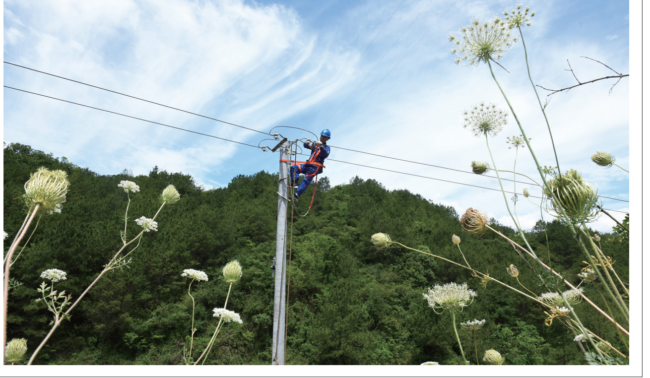
电力工人为石龙村架设抗旱专线。旺苍县嘉川镇石龙村有52亩农田处于地势较高位置,属于靠天吃饭的“望天田”。眼下正值插秧秧苗的关键时期,当地供电部门架设抗旱专线,组立了18根电杆,展放220伏低压导线1.6公里,彻底解决了石龙村抽水灌溉用电难题。