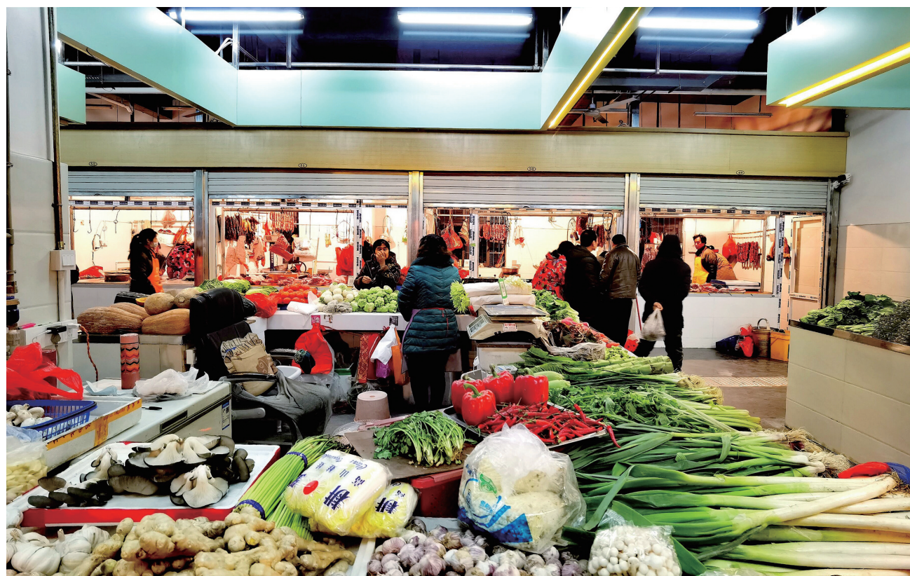
新嘉陵市场建成营业

外,智能支付、产品溯源、线上市场是“智慧”的核心,让买菜成为一件“聪明”的事情。