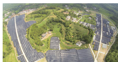
昭化区晋贤乡熨斗村香菇特色产业园(资料图)

创新实施“三园联动”、研制“七条措施”、构建贫困群众稳定增收长效机制……近年来,全市农业系统始终把大力发展山区农业优势特色产业作为贫困群众脱贫增收的重要渠道,始终把提升产业质效作为产业发展的重要目标,始终把贫困农户产业与全市农业优势特色产业主导产业集群延伸融合发展、增强造血功能作为着力重点,走出一条具有广元山区特色的农业产业扶贫新路子。