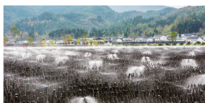
扶贫产业基地-红旗食用菌现代农业园区(资料图)