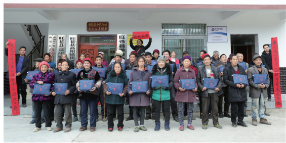
送法进村,“法治礼包”惠民。(资料图)