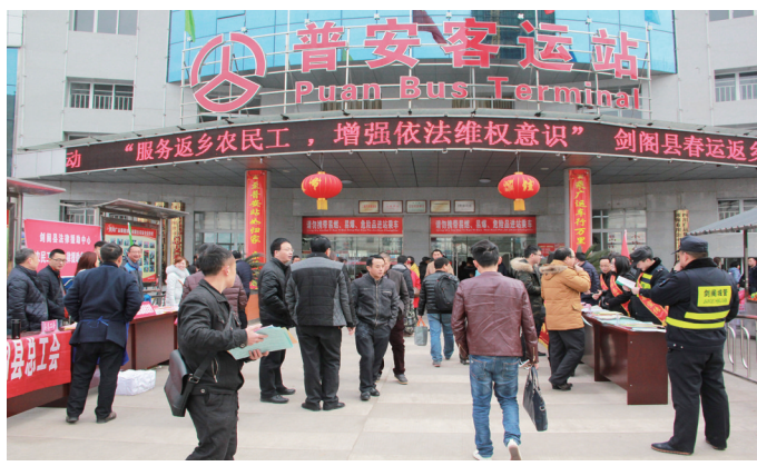
送法到客运站,服务农民工。(资料图)