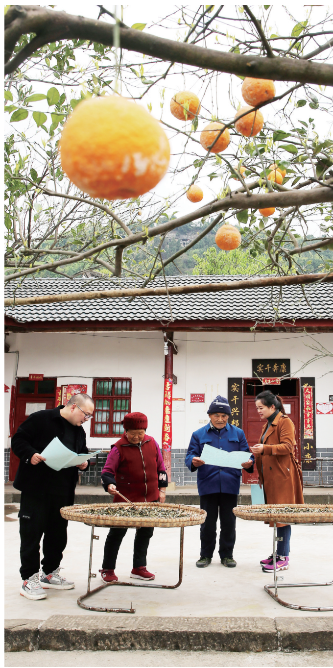
送法入户,引导群众学法用法。