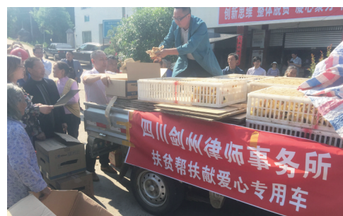
帮扶献爱心,助推产业发展。(资料图)

受得到法治保障。培育村民议事会、道德评议会等群众组织2000余个,通过“天网”视频比对破获贫困地区刑事案件同比上升38%,排查化解涉及贫困群众矛盾纠纷1.5万余件,化解扶贫领域信访难案、积案180余件。