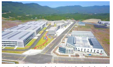
俯瞰中国西部(广元)绿色家居产业城昭化片区

我国正处于实现中华民族伟大复兴的关键时期，以国内大循环为主体、国内国际双循环相互促进的新发展格局加快构建，将为广元加速转型升级和动能转换、建立适应扩大内需要求的产业体系、激发新的增长潜力提供新支撑；