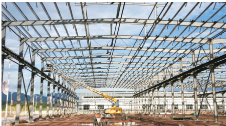
四川中发新材料有限公司建设现场

近年来，我市林地保有量稳定在1500万亩以上，活立木总蓄积约5900万立方米，周边地区林木资源也很丰富，从国外进口木材的供应渠道畅通，丰富的林木资源能够满足家具上下游企业的生产需要。